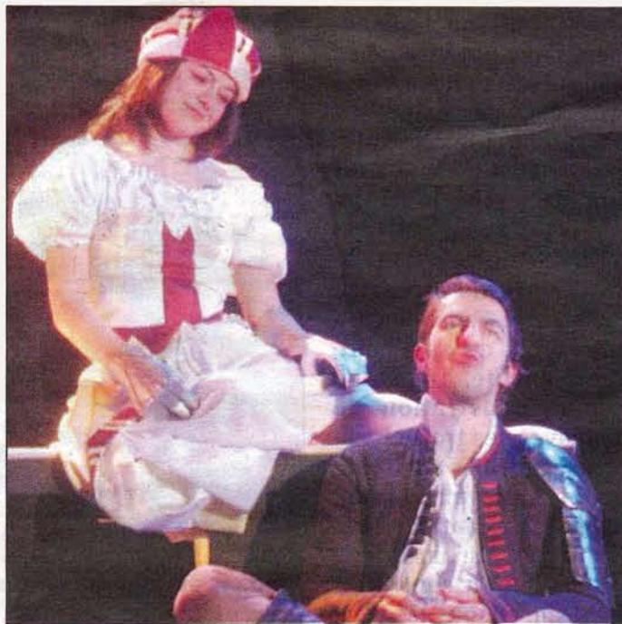
La compagnie « Voix public » s'est déjà produite à plusieurs reprises à Puget-Théniers.

Répétitions ouvertes, ateliers théâtre et d'écriture se sont succédé tout au long du processus de création. Les comédiens et le metteur en scène ont par ailleurs reçu des groupes du collège, de l'école primaire, du centre de loisirs et du Cépage. Le travail scénique a ainsi pu se nourrir du fruit de